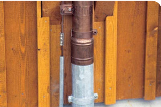
Eine regelmässige Sichtkontrolle des Blitzschutzsystems und der Verbindungen ist erforderlich.