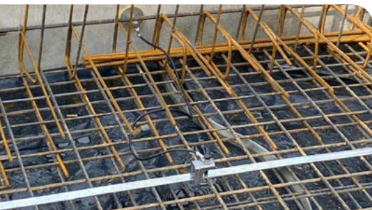
Anschlussgarnitur an den Fundamentanker