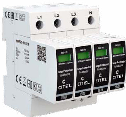
Der Überspannungsschutz schützt Elektroinstallationen und die daran angeschlossenen Geräte.