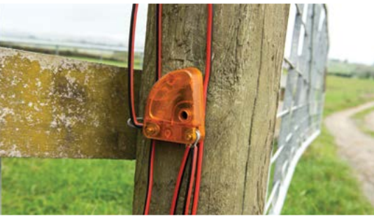
Spezielle Blitzschutzelemente in der Zaunzuleitung leiten den Strom aus Überspannungen zur Erde ab.