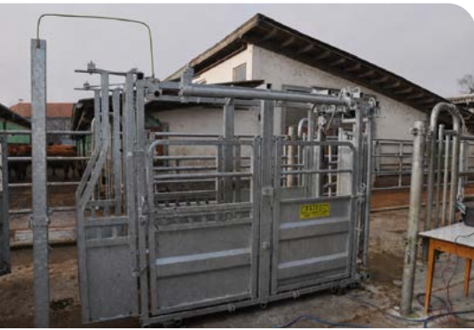
Potenzialausgleich zwischen Elementen einer Treib- und Behandlungsanlage