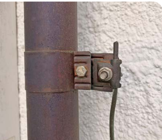
Über Ableitungen wird der Strom zur Erdungsanlage geleitet.