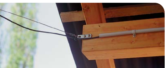
Gut ausgeführte Zaunzuleitung: Hochspannungskabel in schwerentflammbare Rohre verlegt. Zur Überführung im Freien ist ein Drahtseil als Stütze gespannt.